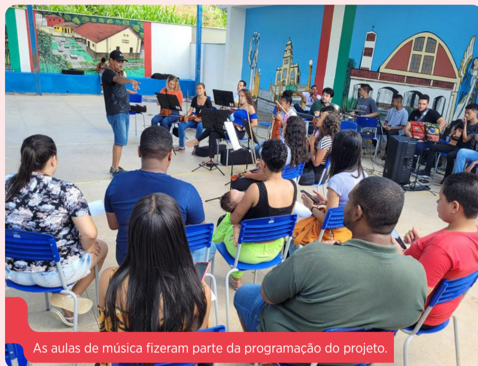
As aulas de música fizeram parte da programação do projeto.