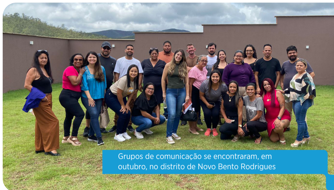
Grupos de comunicação se encontraram, em outubro, no distrito de Novo Bento Rodrigues

“Eu estive em Bento Rodrigues quando ainda estava na planta, por fazer parte do Conselho Consultivo. A gente entende que nada é capaz de reparar ou compensar o ocorrido. Então foi especial retornar e ver as famílias morando, assim como em Paracatu.”