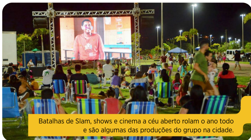
Batalhas de Slam, shows e cinema a céu aberto rolam o ano todo e são algumas das produções do grupo na cidade.

Quem quer acompanhar, soltar a criatividade e participar das ações do Grupo Decola pode ver as divulgações e entrar em contato pelo instagram @grupodecola