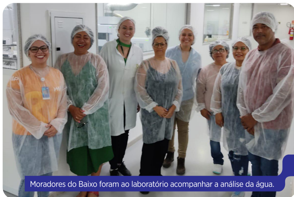
Moradores do Baixo foram ao laboratório acompanhar a análise da água.

Os resultados das análises ficam prontos de um a três meses depois da coleta, podem ser apresentados em uma reunião aberta em cada comunidade e disponibilizados no site