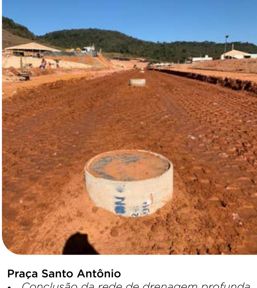
Praça Santo Antônio