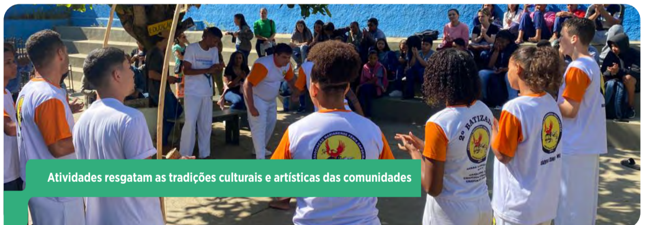
Atividades resgatam as tradições culturais e artísticas das comunidades

Confira o que vai rolar em cada comunidade e faça a sua inscrição! Toda a programação é gratuita.