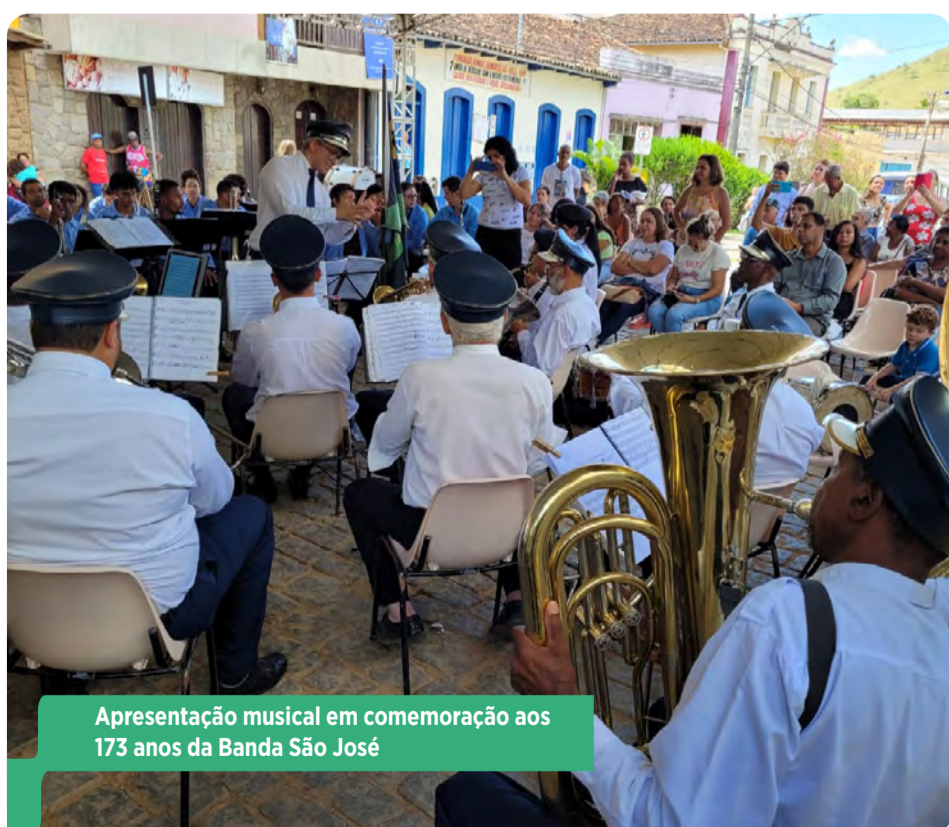
Apresentação musical em comemoração aos 173 anos da Banda São José