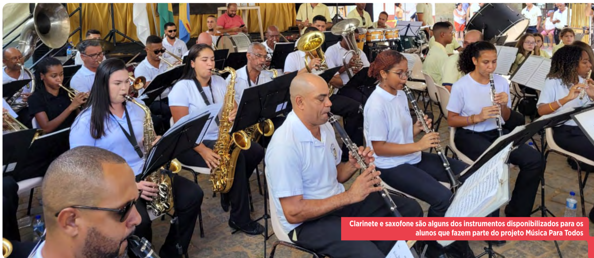
Clarinete e saxofone são alguns dos instrumentos disponibilizados para os alunos que fazem parte do projeto Música Para Todos

Imagina aprender a tocar instrumentos, entender as notas musicais e ainda melhorar a concentração e a disciplina? É o que a Corporação Musical União São José oferece para os moradores de Barra Longa e região que participam do projeto Música Para Todos.