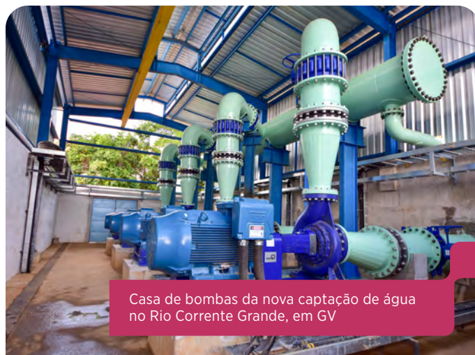
Casa de bombas da nova captação de água no Rio Corrente Grande, em GV

O pessoal também pôde conhecer e observar a interligação da água do Rio Corrente Grande à Estação de Tratamento de Água (ETA) Central. Os próximos passos serão a interligação da tubulação, que já está dentro das ETAs Vila Isa e Santa Rita, e a instalação dos instrumentos de controle e automação. Assim vai ser possível ampliar o abastecimento com a nova captação também para essas regiões de Valadares.