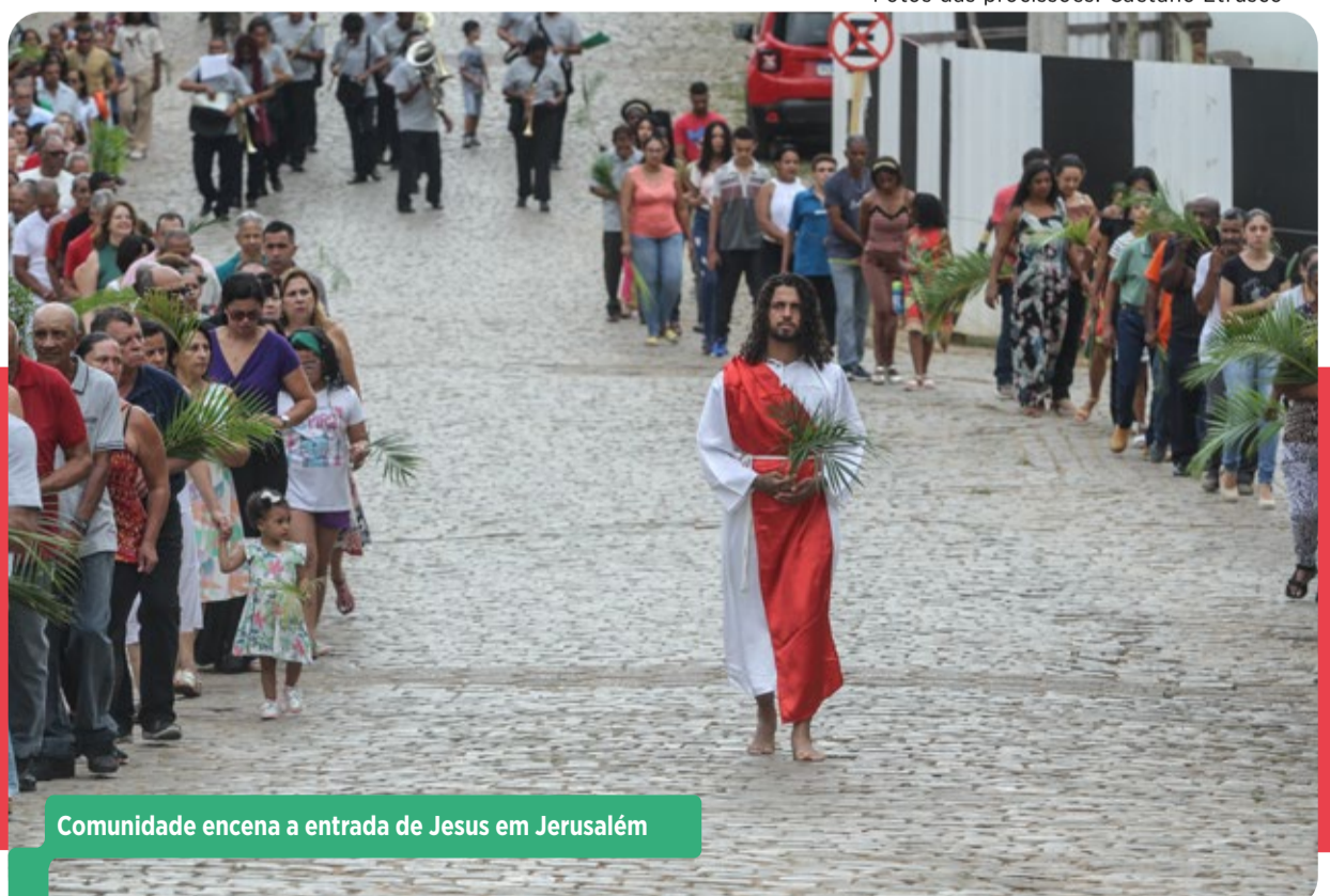
Comunidade encena a entrada de Jesus em Jerusalém

Durante sete dias, entre o Domingo de Ramos e o Domingo de Páscoa, as comunidades de Barra Longa e Rio Doce realizam diversas cerimônias para relembrar a paixão, a morte e a ressurreição de Jesus Cristo. A programação conta com missas, procissões e a produção dos tradicionais tapetes de serragem nas ruas.