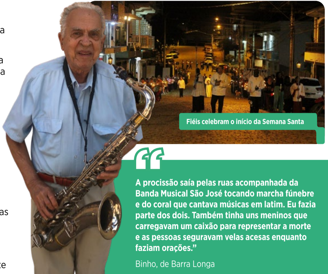
Fiéis celebram o início da Semana Santa

“A visão dela ficou toda branca, porque as almas desceram para o salão da igreja na mesma hora que ela estava lá.”