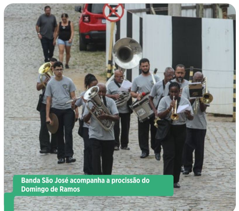
Banda São José acompanha a procissão do Domingo de Ramos