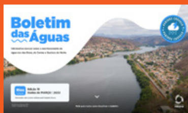
Boletim das Águas fundacaorenova.org