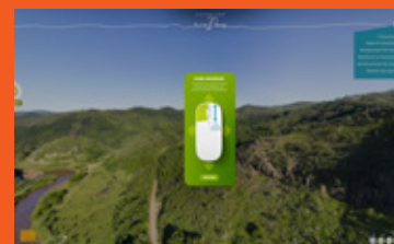
Portal da Expedição Rio Doce expedicaoriodoce.fundacaorenova.org

Se você ainda tem dúvidas sobre os programas atuantes no território, entre em contato com a gente pelo 0800 031 23 03 ou pela equipe de Diálogo Social. E participe dos próximos fóruns Resulta.