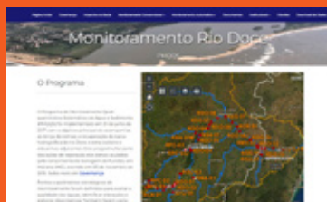
Portal Monitoramento Rio Doce monitoramentoriodoce.org

Você pode acompanhar pelos endereços abaixo os dados da qualidade da água na bacia do rio Doce. Eles são atualizados periodicamente.