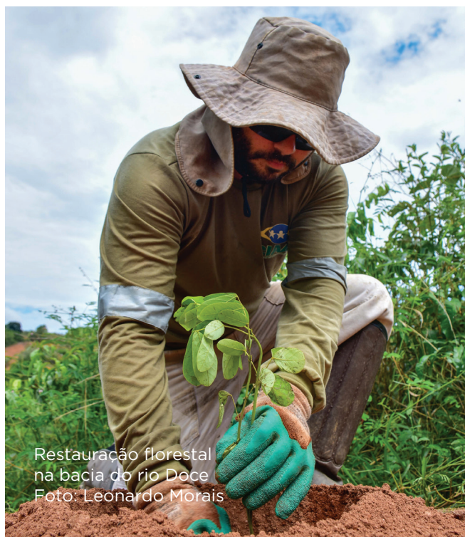
Restauração florestal na bacia do rio Doce

Em sua segunda edição, o Edital Doce selecionou mais de 50 projetos nas áreas de cultura, esporte, lazer e turismo em nossa região. Trata-se de iniciativas locais, que serão desenvolvidas pelos moradores de cada região a partir de setembro. Conheça os projetos selecionados em nossa região em fundacaorenova.org/edital-doce/2022