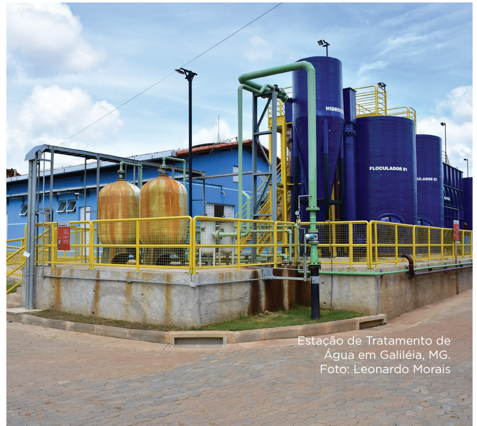
Estação de Tratamento de Água em Galiléia, MG.

Em Galiléia, um novo sistema de abastecimento de água foi entregue em 2020 para a comunidade, com uma Estação de Tratamento de Água (ETA) e uma captação alternativa em poços subterrâneos. Veja como ela funciona: