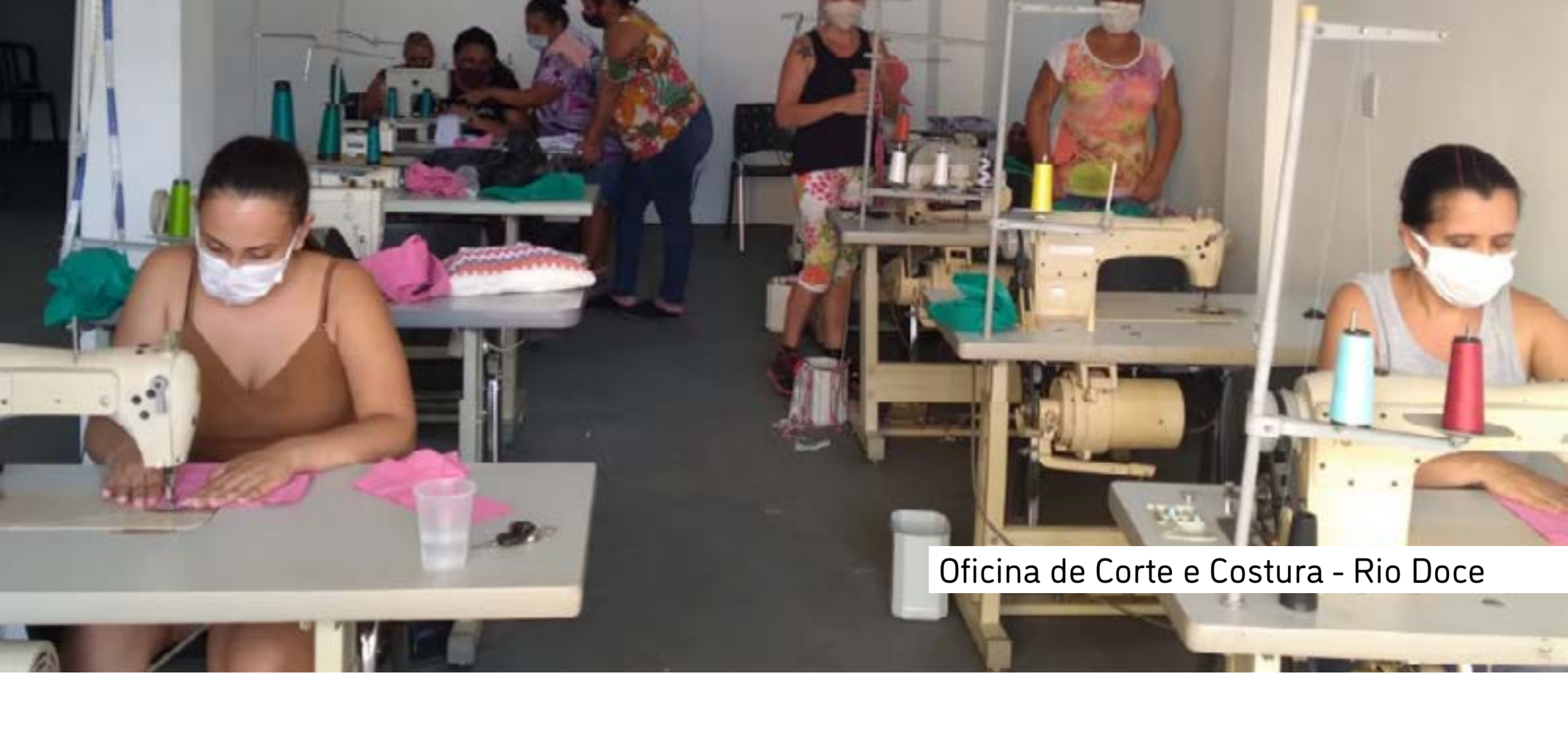
Oficina de Corte e Costura - Rio Doce

Fortalecer as potencialidades produtivas, aumentando as possibilidades de gerar trabalho e renda: esse é o objetivo da oficina de Corte e Costura realizada no município de Rio Doce, com 32 participantes do Centro de Referência de Assistência Social (Cras) — a maior parte mulheres.