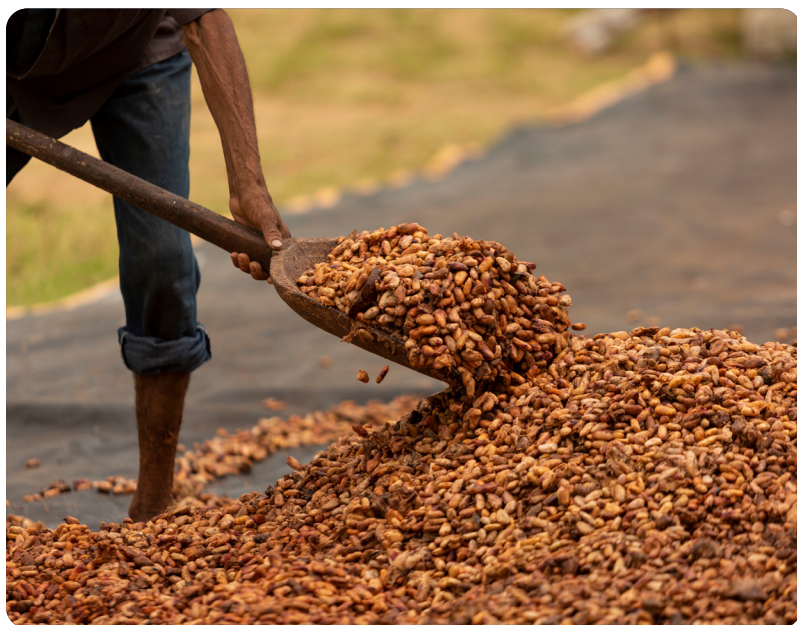
#PRACEGOVER: foto de uma pá cheia de amêndoas secas de cacau que está sendo colocada em uma pilha por um produtor.

há outras cadeias de produção que não podem ser esquecidas. Quando a gente traz a realidade do programa pras ilhas e pros agricultores de subsistência, quase não se tem ainda atingidos sendo beneficiados”, relatou.