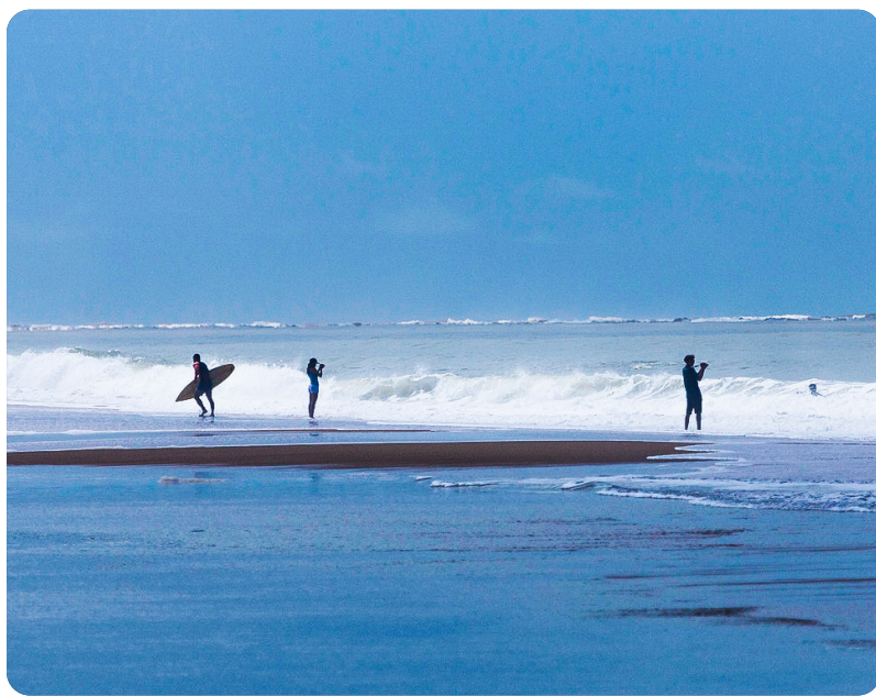
#PRACEGOVER: foto de praia com um céu azulado e ensolarado, na Vila de Regência, onde cinco pessoas entram e saem do mar, algumas com pranchas nas mãos para a prática de surfe, uma das principais atividades esportivas da região.

O Sistema Indenizatório Simplificado segue em atividade na região da Foz do Rio Doce. Com ele, veio a esperança de dias melhores para a reparação financeira de categorias que sofreram danos de difícil comprovação com o rompimento da barragem. Porém, em meio às comunidades de Linhares, há grupos insatisfeitos com a forma como o processo está sendo desenvolvido.