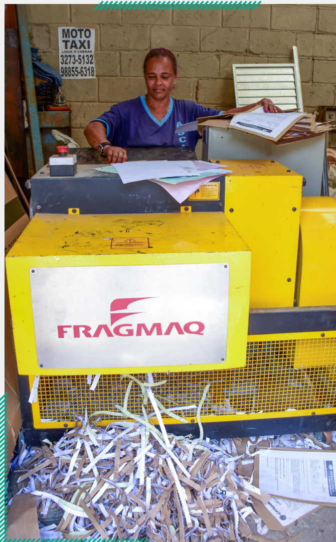
Fragmentadora de papel possibilita que documentos confidenciais, de bancos, correios e outros, sejam descartados com segurança.

Ao todo, 20 instituições do leste mineiro e de Baixo Guandu (ES) foram apoiadas nas duas Chamadas de Projetos lançadas em 2019.