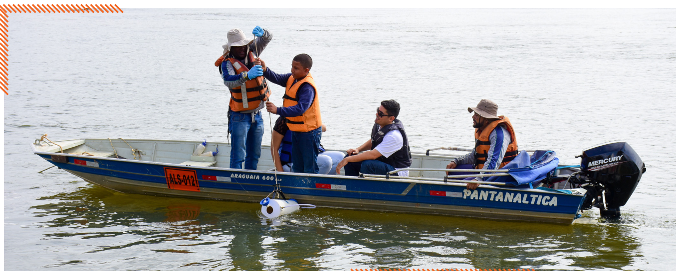
Durante uma ação de educação ambiental, crianças coletaram água do rio Doce e aprenderam como funciona o monitoramento.

Entre os 92 pontos de monitoramento , estão 22 estações automáticas , que geram informações aos órgãos públicos em tempo real. Em Minas Gerais, existem 31 pontos , sendo três deles em Governador Valadares.