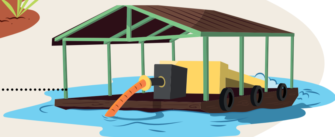
Ilustração: Humberto Guima

Atua no solo e utiliza maquinário, como draga e escavadeira. Trabalha em grupo.