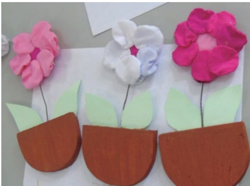
Flores de artesanato ajudam mães durante a amamentação