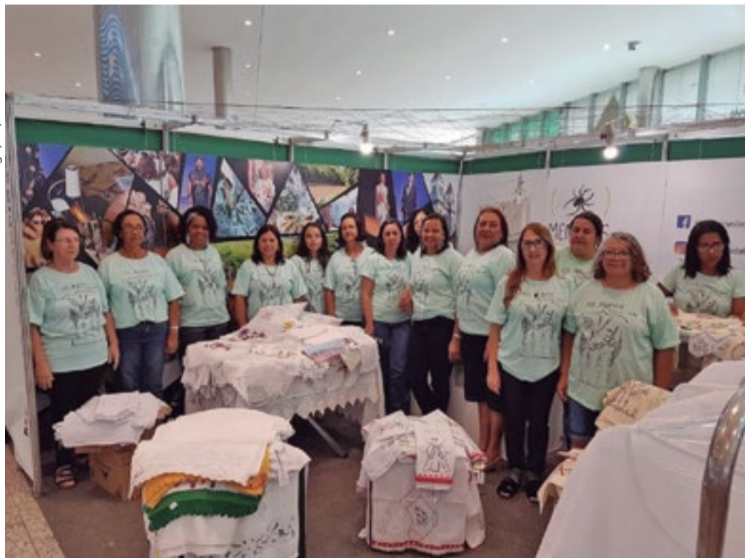
Bordadeiras participaram da Feira Nacional de Artesanato