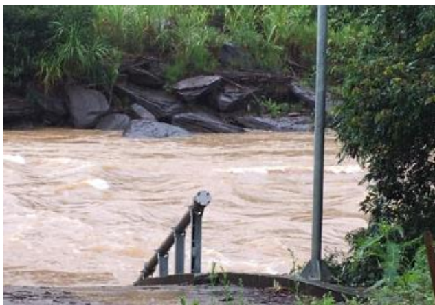
Foto 7 – RDO 02: Rio Doce em Santa Cruz do Escalvado/ MG, após vertedouro da Barragem Candonga