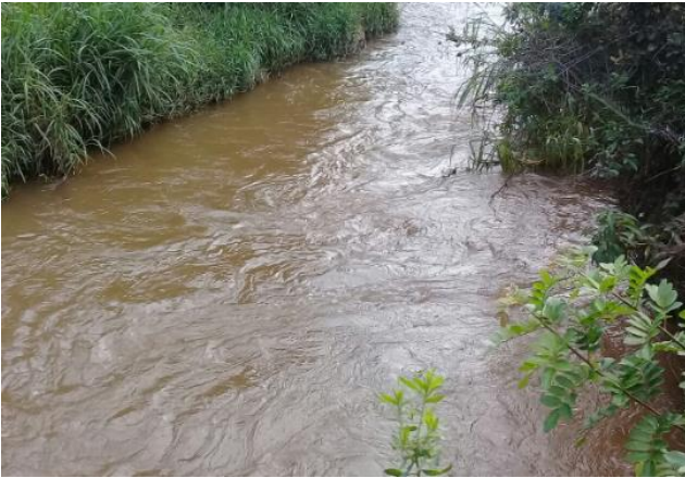
Foto 1 – RGN 01: Rio Gualaxo do Norte a montante da confluência com o córrego Santarém em Mariana/MG, em área não afetada com rejeitos