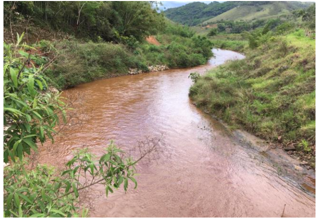
Foto 2: RGN 06: Rio Gualaxo do Norte em Ponte Paracatu em Mariana/MG