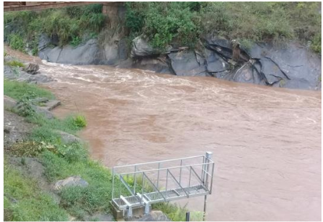
Foto 4 – RCA 01: Rio do Carmo em Acaiaca/MG, em área não afetada com rejeitos