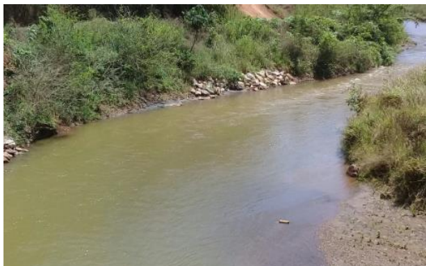
Foto 2: RGN 06: Rio Gualaxo do Norte em Ponte Paracatu em Mariana/MG