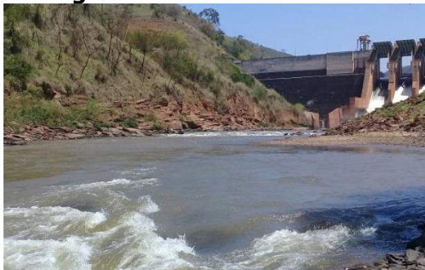
Foto 7 – RDO 02: Rio Doce em Santa Cruz do Escalvado/ MG, após vertedouro da Barragem Candonga