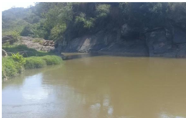
Foto 4 – RCA 01: Rio do Carmo em Acaiaca/MG, em área não afetada com rejeitos