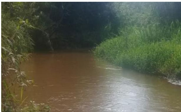
Foto 1 – RGN 01: Rio Gualaxo do Norte a montante da confluência com o córrego Santarém em Mariana/MG, em área não afetada com rejeitos