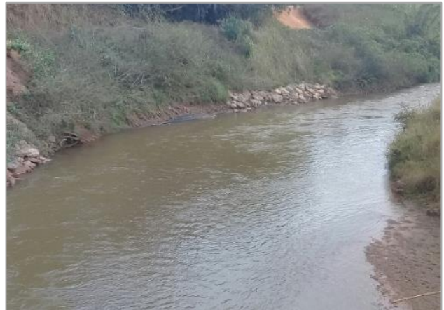
Foto 2: RGN 06: Rio Gualaxo do Norte em Ponte Paracatu em Mariana/MG.