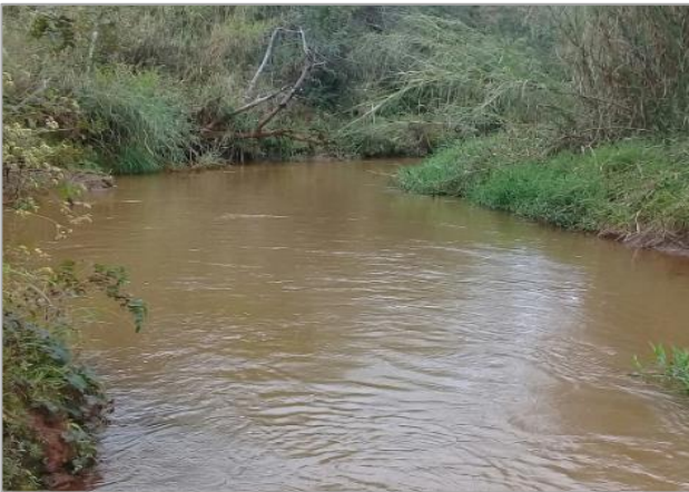
Foto 1 – RGN 01: Rio Gualaxo do Norte a montante da confluência com o córrego Santarém em Mariana/MG, em área não afetada com rejeitos.