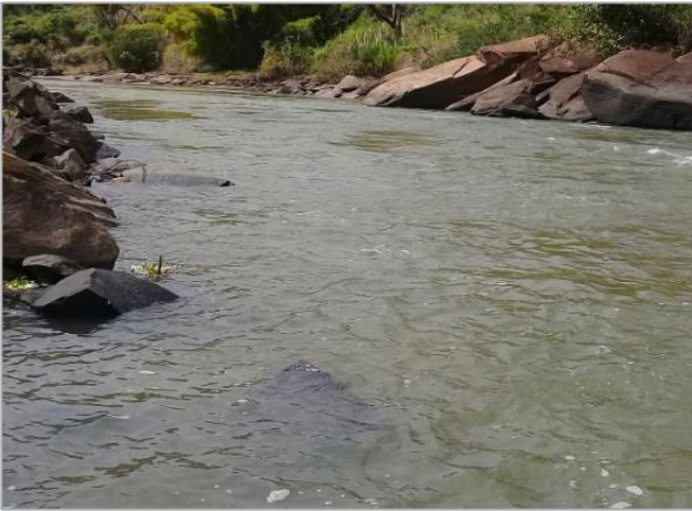
Foto 7- RDO 02: Rio Doce em Santa Cruz do Escalvado/ MG, após vertedouro da Barragem Candonga