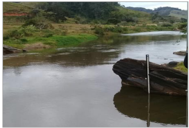
Foto 4 – RCA 01: Rio do Carmo em Acaiaca/MG, em área não afetada com rejeitos.