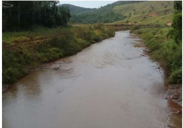
Foto 2: RGN 06: Rio Gualaxo do Norte em Ponte Paracatu em Mariana/MG.