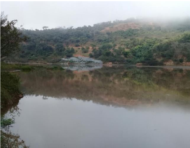
Foto 7 – UMR 01: Rio Doce em Santa Cruz do Escalvado/ MG, montante da Dragagem UHE Candongada