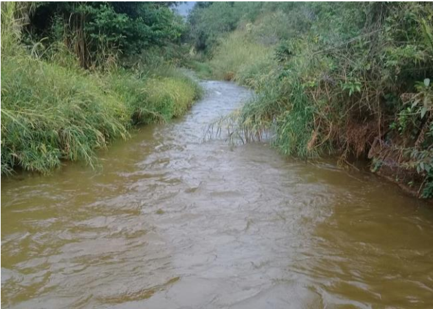
Foto 1 – RGN 01: Rio Gualaxo do Norte a montante da confluência com o córrego Santarém em Mariana/MG, em área não afetada com rejeitos.