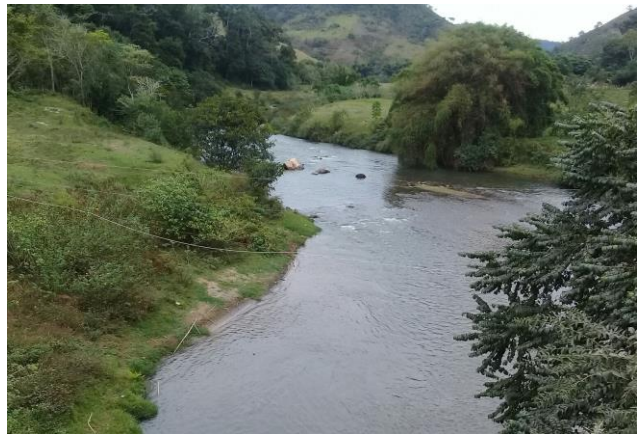
Foto 4 – RCA 01: Rio do Carmo em Acaiaca/MG, em área não afetada com rejeitos.