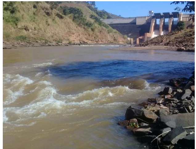
Foto 8– RDO 02: Rio Doce em Santa Cruz do Escalvado/ MG, após vertedouro da Barragem Candonga